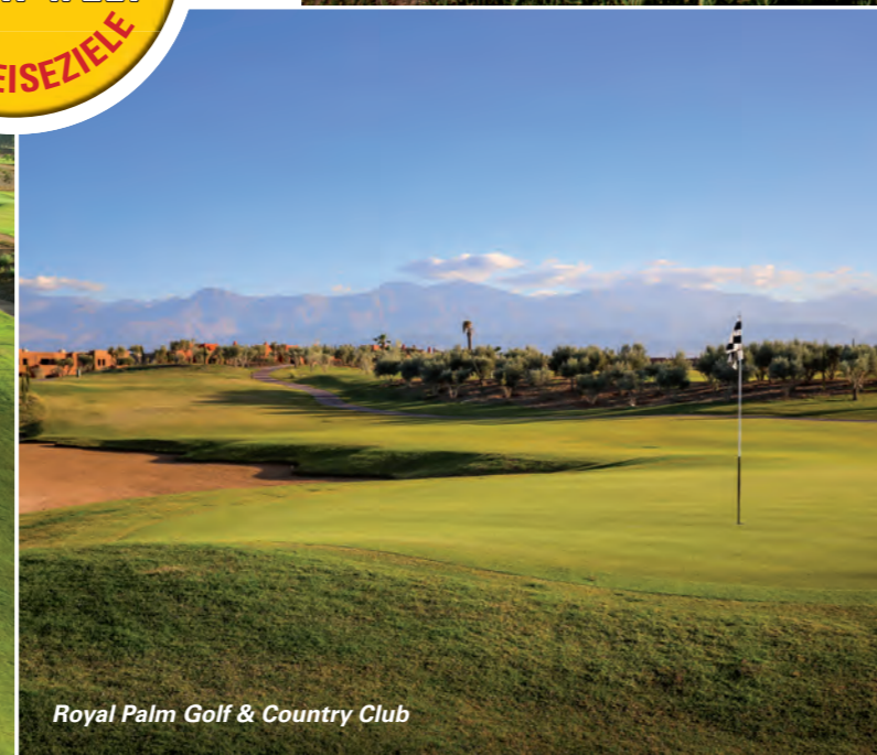
Royal Palm Golf & Country Club