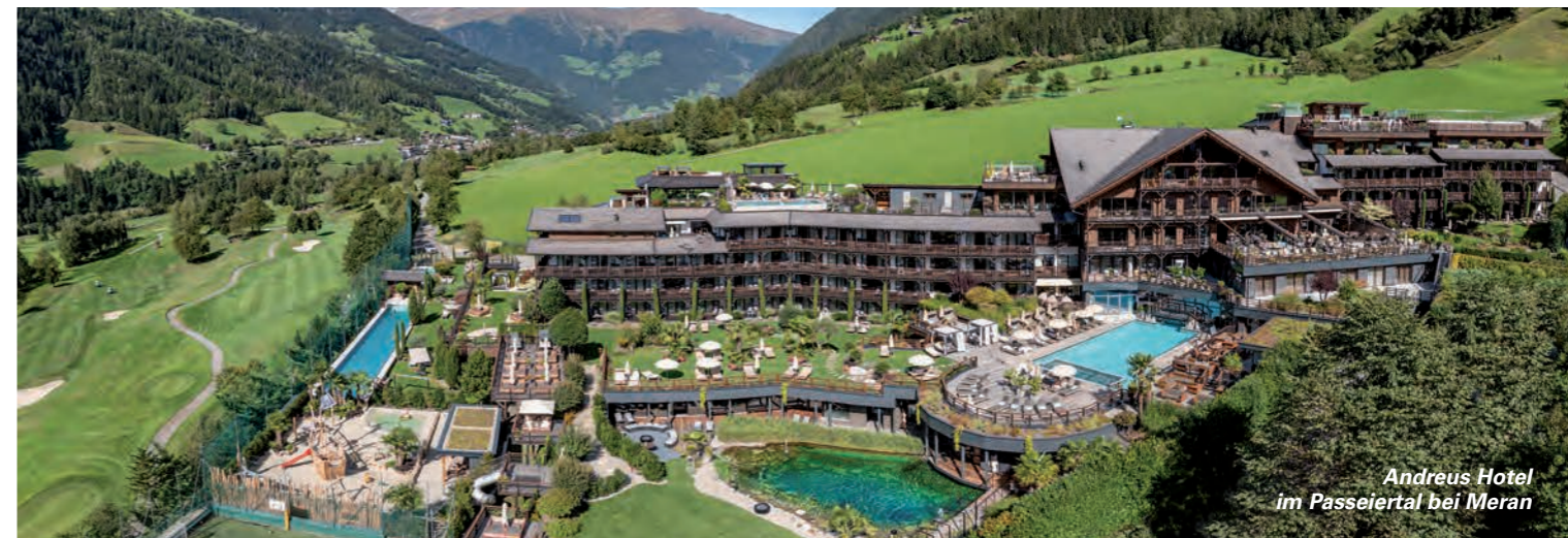
Andreus Hotel im Passeiertal bei Meran